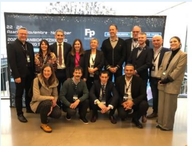
LCAMPeren familia-argazkia VET Summit-en, Donostian.

LCAMPeko bazkide TKNIKA (antolatzaileak), Miguel Altuna LHII , Curt Nicolin Bigarren Hezkuntzako Eskola (Suedia) eta Kocaeli, Turkiako Hezkuntza Nazionalako Ministerioa izan ziren besteak beste 23 herrialdetako 400 parte-hartzaile baino gehiagoren artean, eraldaketa digital adimendunaren aukerei, erronkei eta arriskuei buruz elkarrekin eztabaidatzeko.