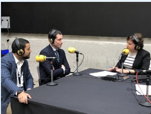
Govor koordinatorja projekta na španskem lokalnem radiu, La Ser.